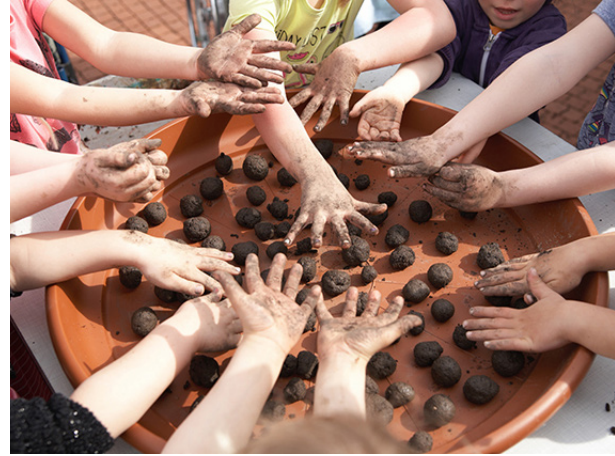
Gemeinsames Tun im Schulgelände